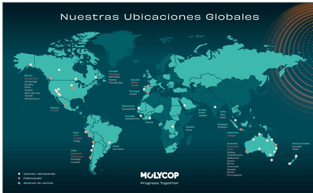
Figura 1: Resumen de las operaciones y ubicaciones globales del grupo corporativo Molycop.

Cada región opera con un grado de autonomía, pero con recursos compartidos (como equipos de apoyo global, políticas y procedimientos) y estructuras comunes de alta dirección para garantizar la coherencia en la funcionalidad y la coordinación de las actividades.