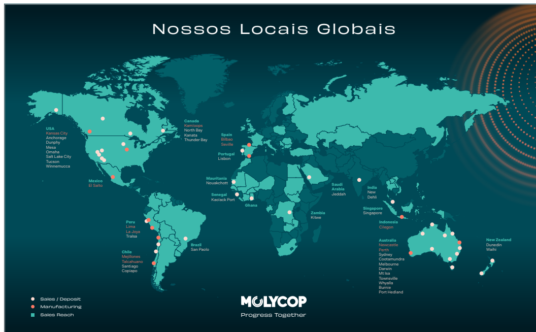
Figura 1: Visão geral das operações e locais globais do grupo corporativo Molycop

Cada região opera com certo grau de autonomia, mas com recursos compartilhados (como equipes de suporte global, políticas e procedimentos) e estruturas comuns de liderança sênior para garantir a consistência da funcionalidade e a coordenação das atividades.